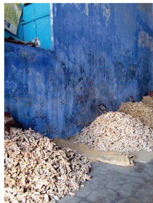
Ci-dessus, de gauche à droite : la baie sublime de Somatheeram. Sacs d’épices au marché de Cochin. Bassin de lotus au Abad Turtle Beach Resort de Mararikulam. Ci-contre : livret de feuilles de palme avec les principaux traités de l’ayurveda. Gingembre à la Ginger Warehouse à Cochin.